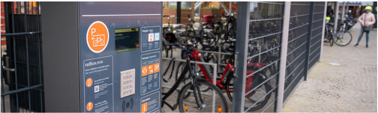
Fietsdoos op de Liebfrauenplatz ►