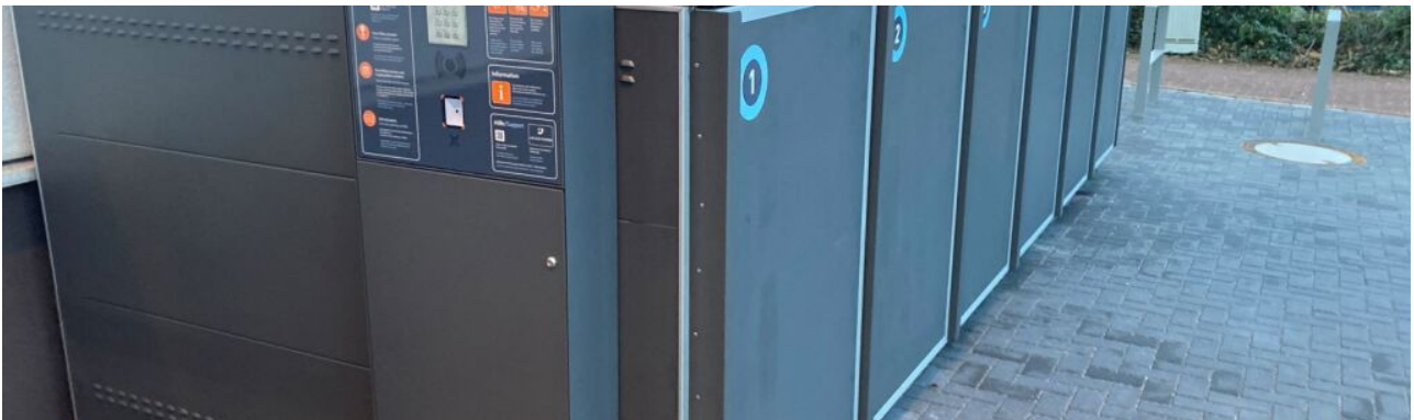
Fietsdoos bij de arcades ►