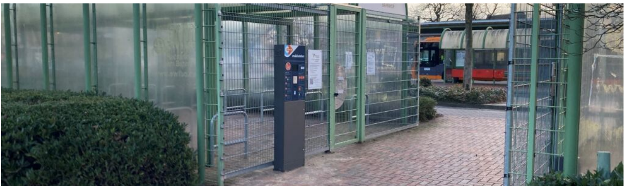
Fietsdoos bij het station ►