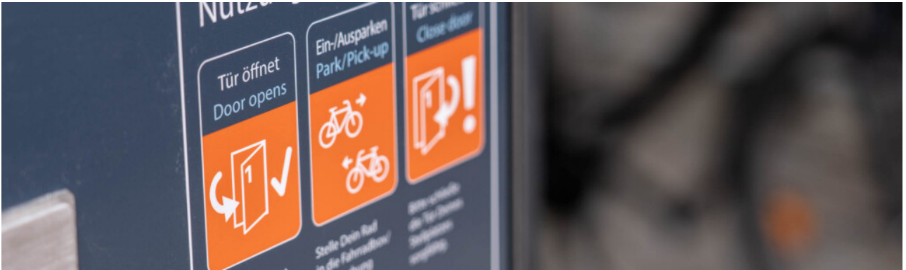
Fietsdoos bij de Bustreff ►