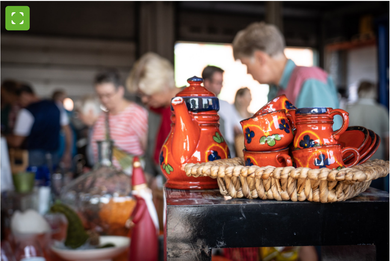
Große und kleine Schätze gibt es bei der ESB-Spermüllbörse zu entdecken und zu kaufen