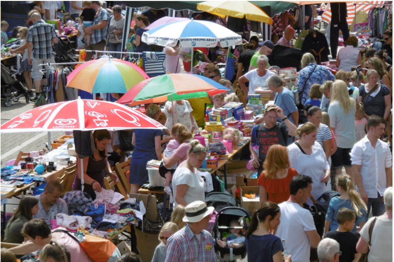
Kinderflohmarkt beim ESB