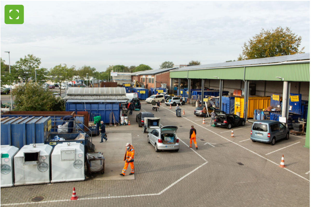
Rund 3 Mio. Mal wurde der Wertstoffhof seit 1997 ausgesucht. Er ist eine feste Einrichtung im System der lokalen Bocholter Müllentsorgung.