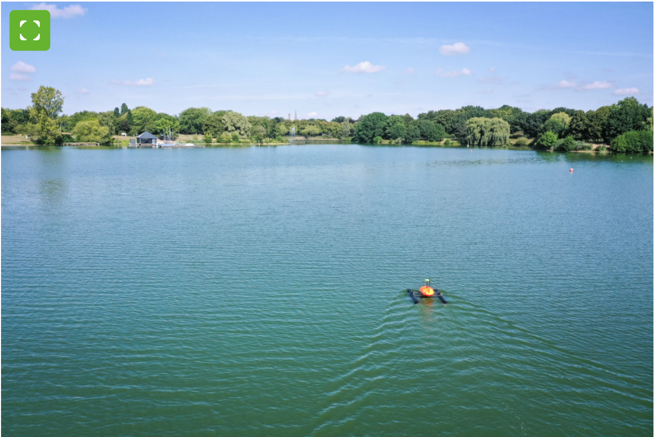
In geraden Bahnen fährt die ferngesteuerte Sonde auf dem Aasee auf und ab