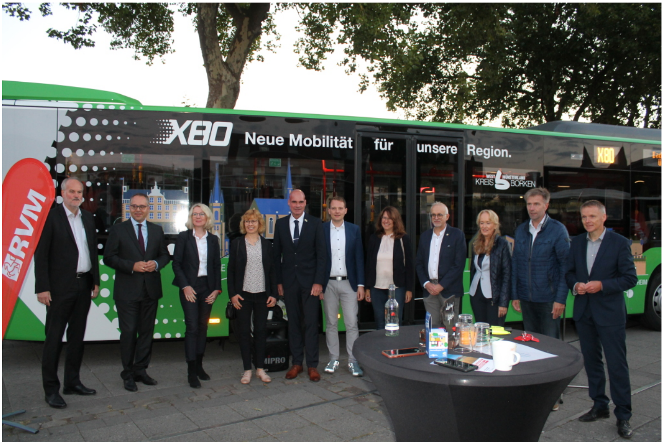
Start des Baumwollexpress X80 in Gronau, u.a. mit Bocholts Bürgermeister Thomas Kerkhoff (2.v.l.).