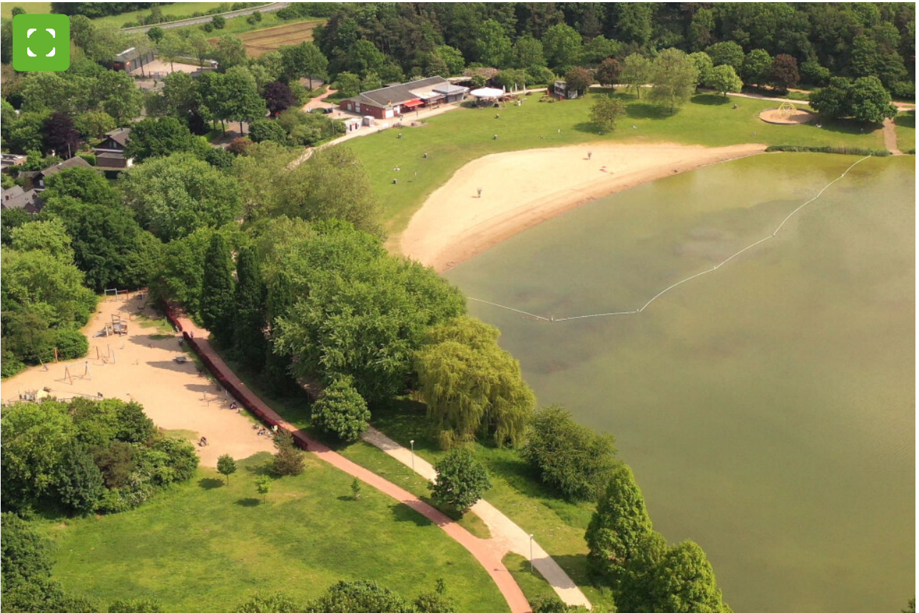
De speeltuin op de noordoostelijke oever bij de baai blijft de hele tijd toegankelijk