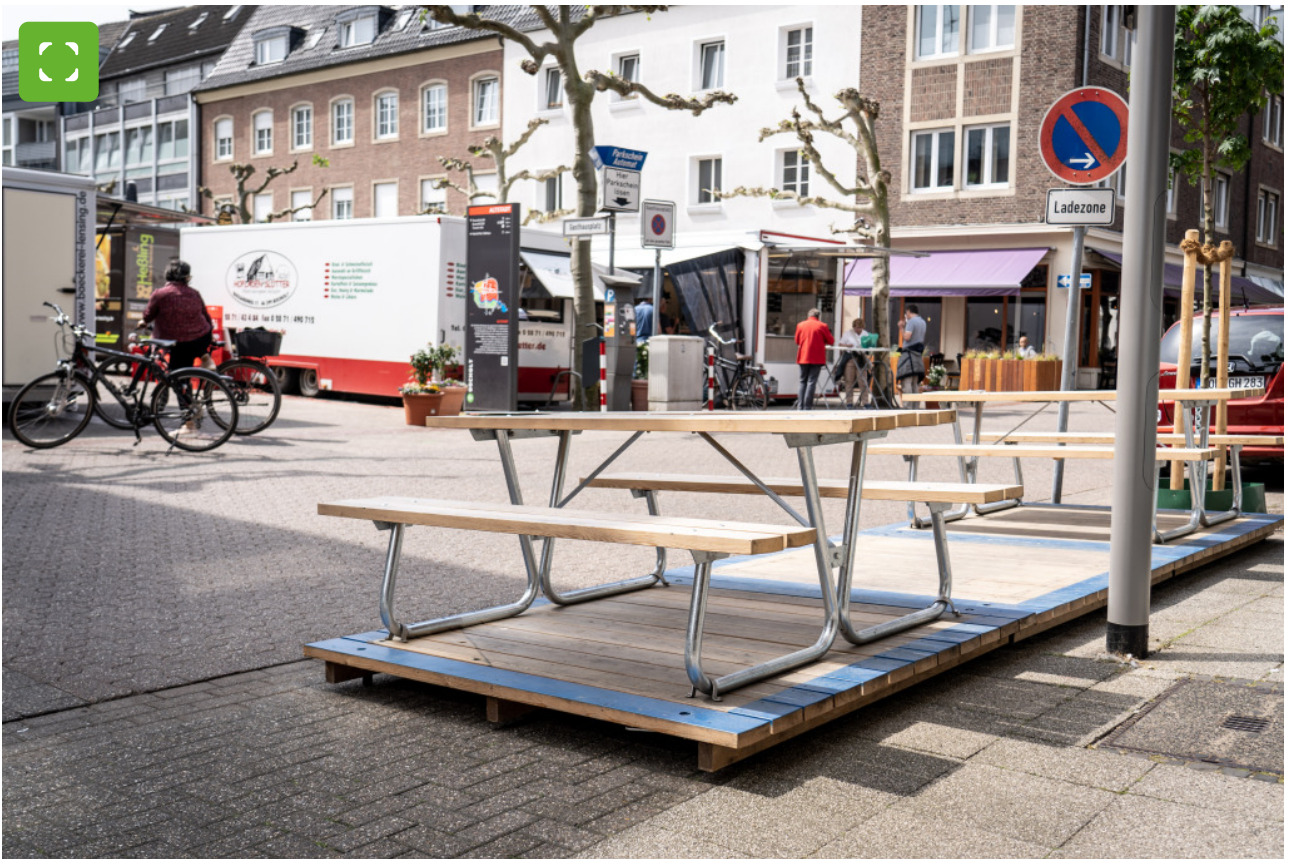
Sonnige Pause vom Marktbesuch einlegen? Mit dem neuen Stadtmobiliar kein Problem.