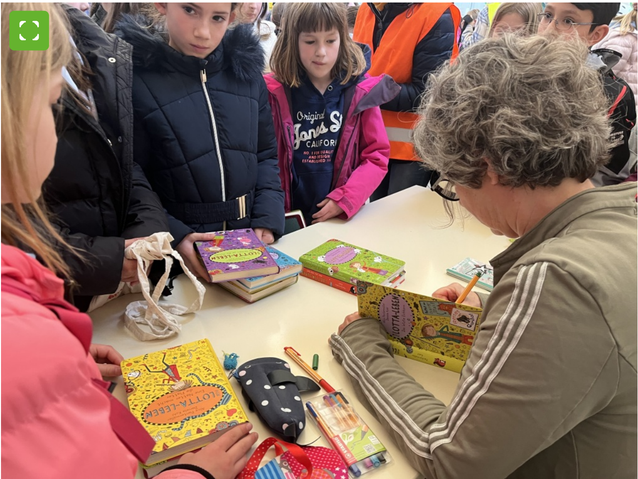
Kinderboekenschrijfster Alice Pantermüller inspireerde kinderen in de stadsbibliotheek