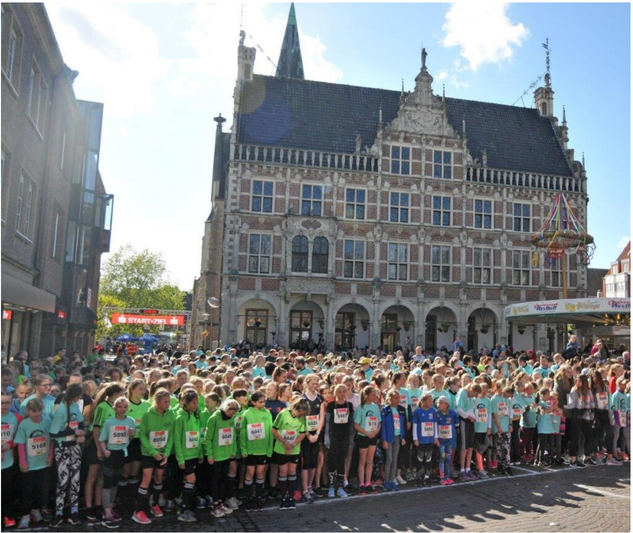
Der Bocholter Citylauf, hier ein Startfoto aus dem Jahr 2019, wagt nach Coronapause den Neustart am 7. Mai.