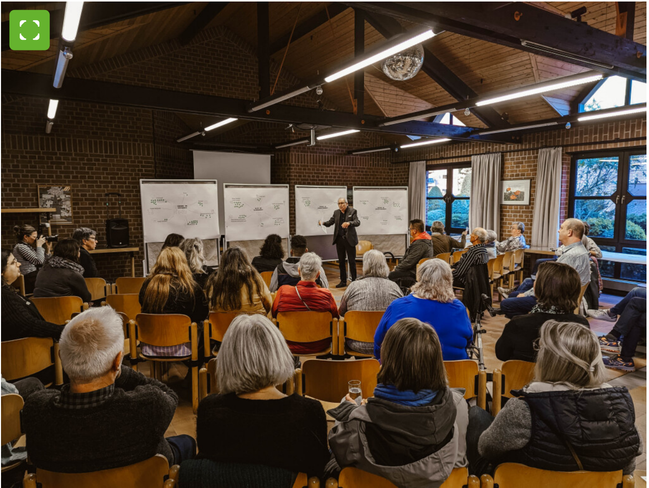
Die Hochschule Düsseldorf stellt die Ergebnisse der Bürgerumfrage aus dem Sommer vor.