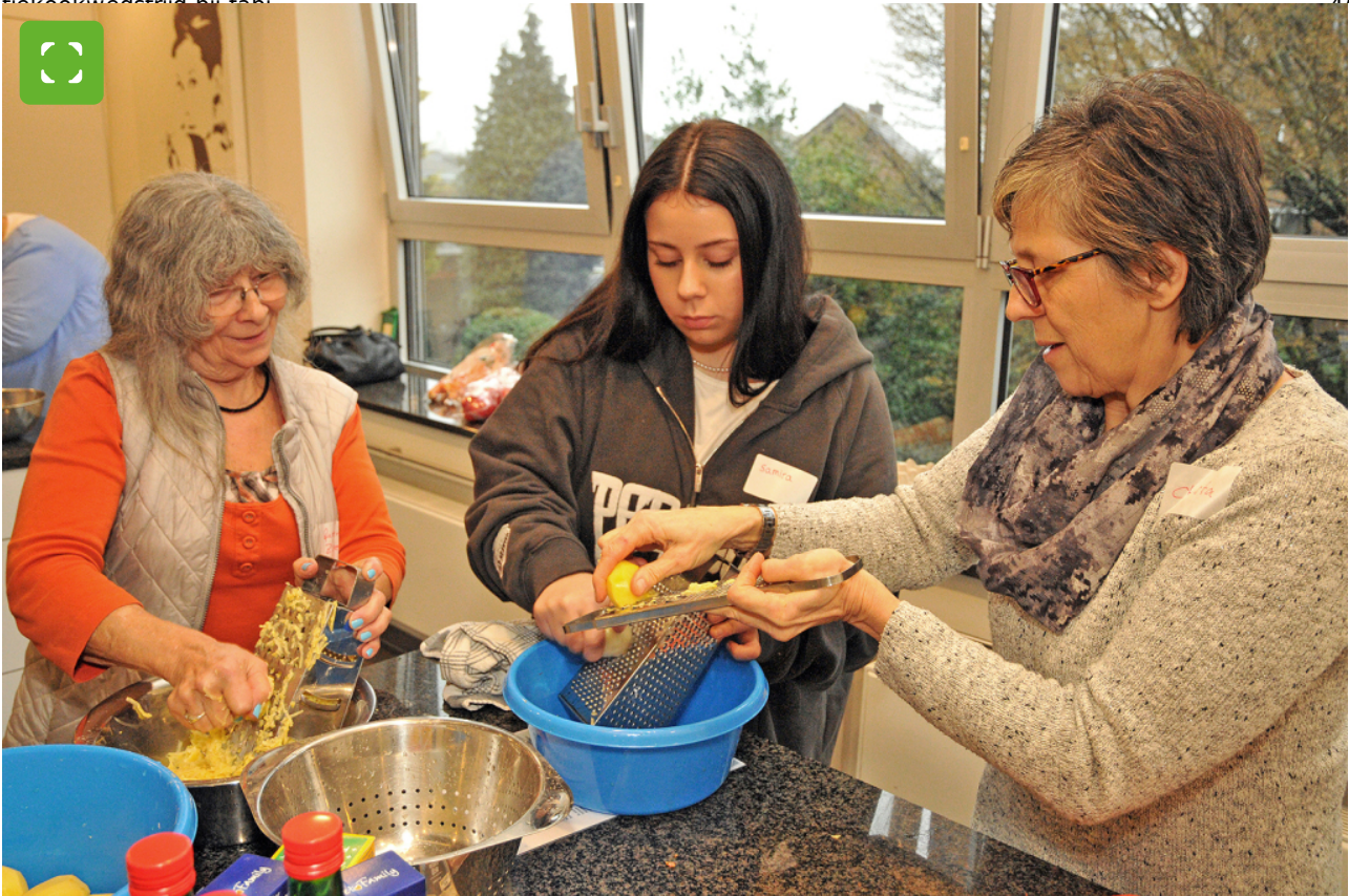
Samen dingen doen en van elkaar leren, zo ziet intergenerationeel koken eruit.