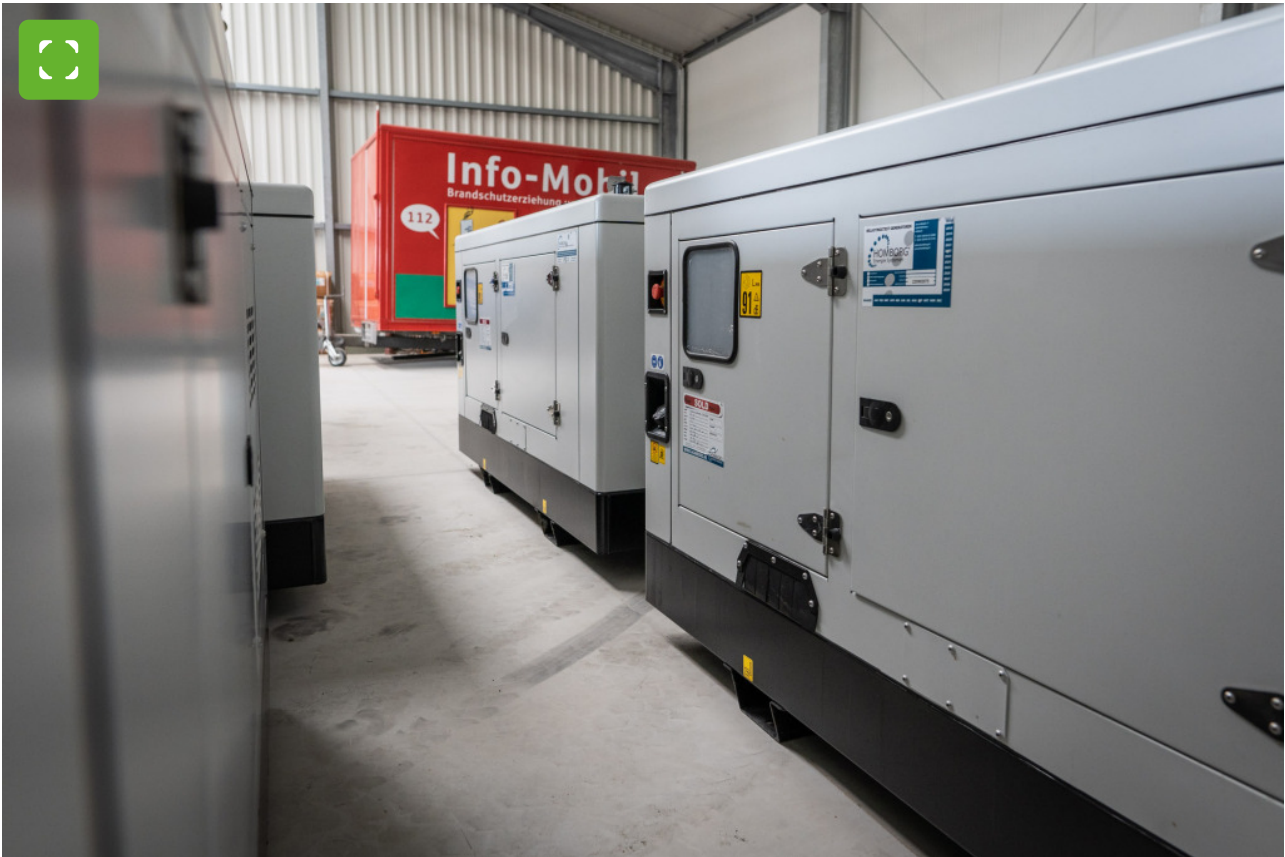
Die Notstromgeneratoren werden mit Kraftstoff betrieben.