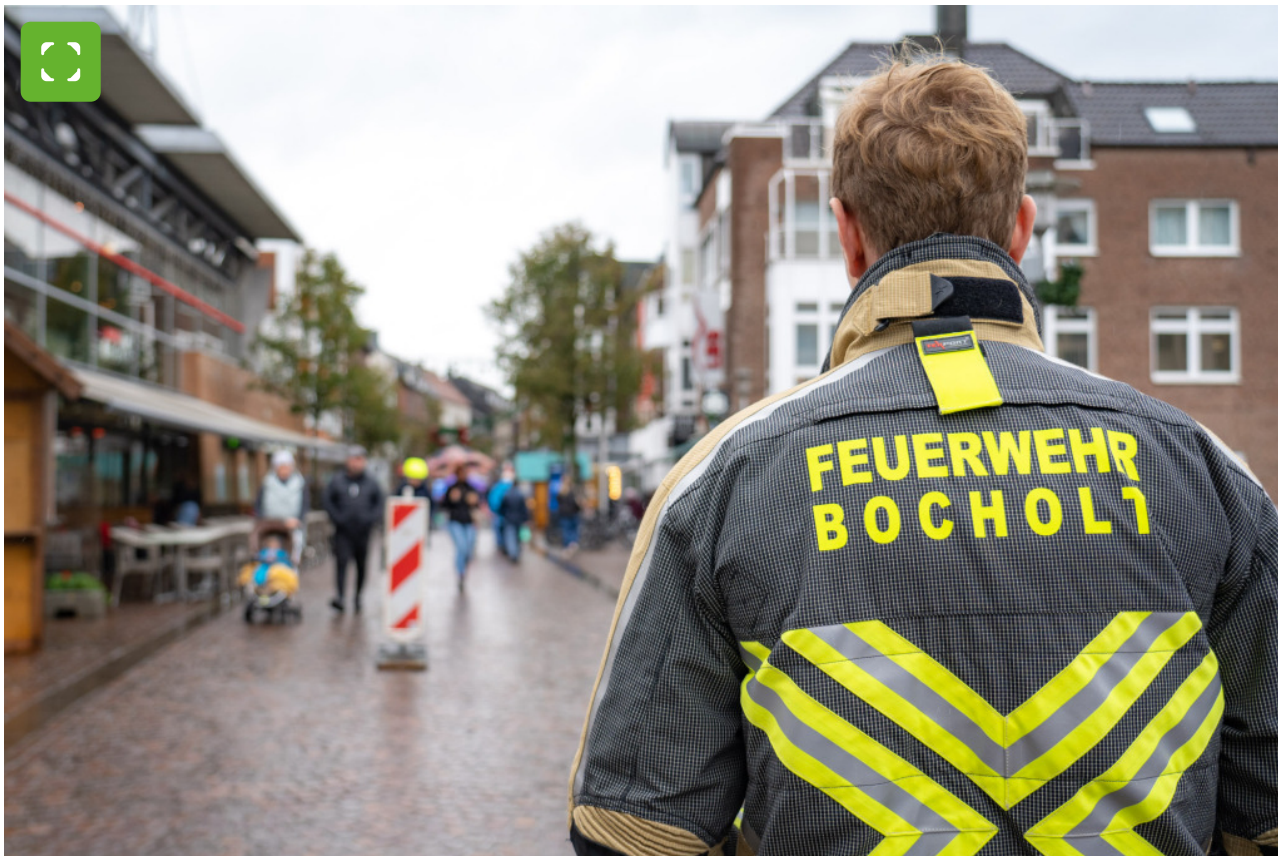
Am Informationsstand am Neutorplatz beantworten Mitarbeiterinnen und Mitarbeiter der Stadt Bocholt Fragen zur Krisenvorsorge