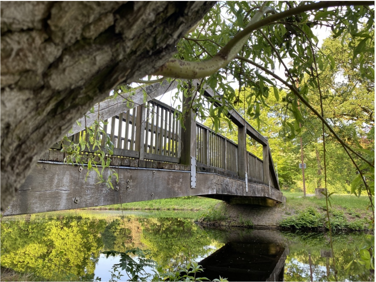
De vervallen brug op de Bocholt Rodelberg wordt binnenkort vervangen.