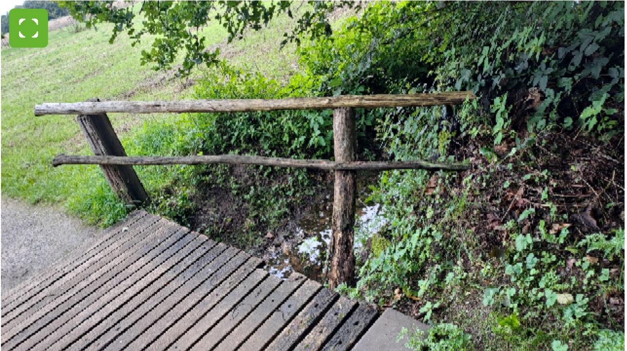
Kapotte houten brug bij de Hochzeitswald in Bocholt.