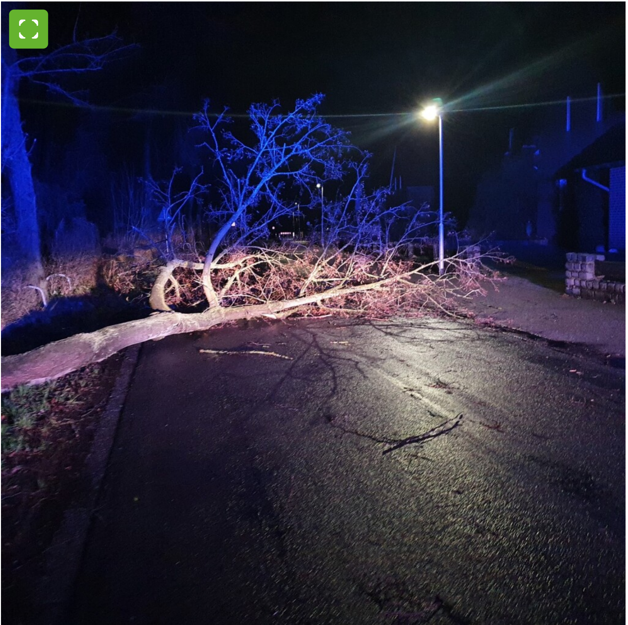
Umgekippter Ahorn versperrt Barloer Weg