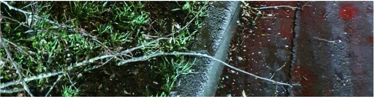
ESB beseitigt umgekippte Linde auf Dinxperloer Straße in Bocholt.