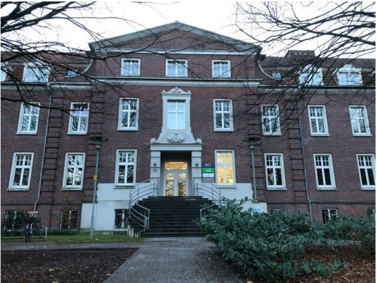
Das Bocholder Weiterbildungszentrum am Stenerner Weg 14a.