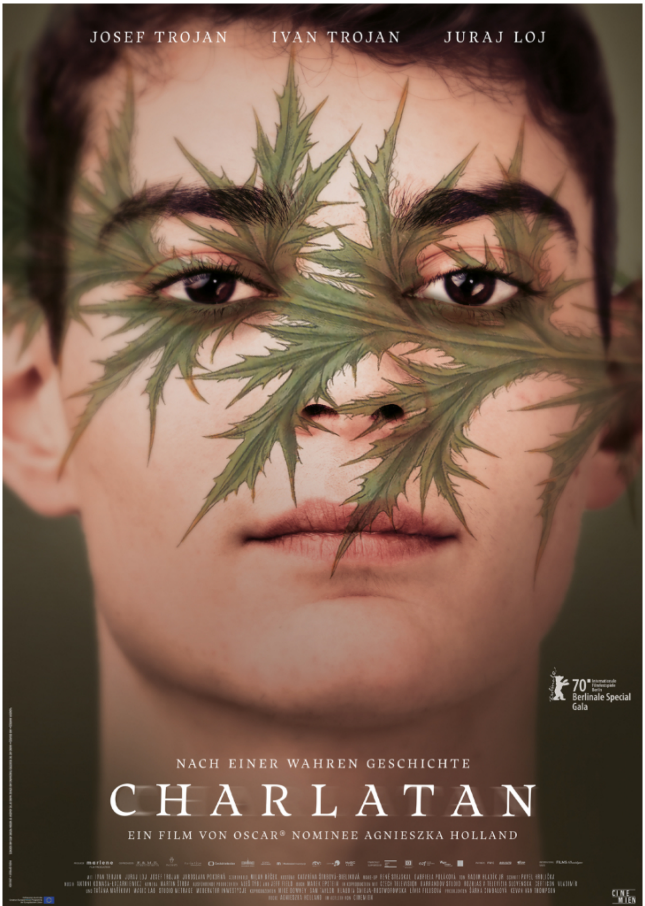
Plakat des Films "Charlatan"