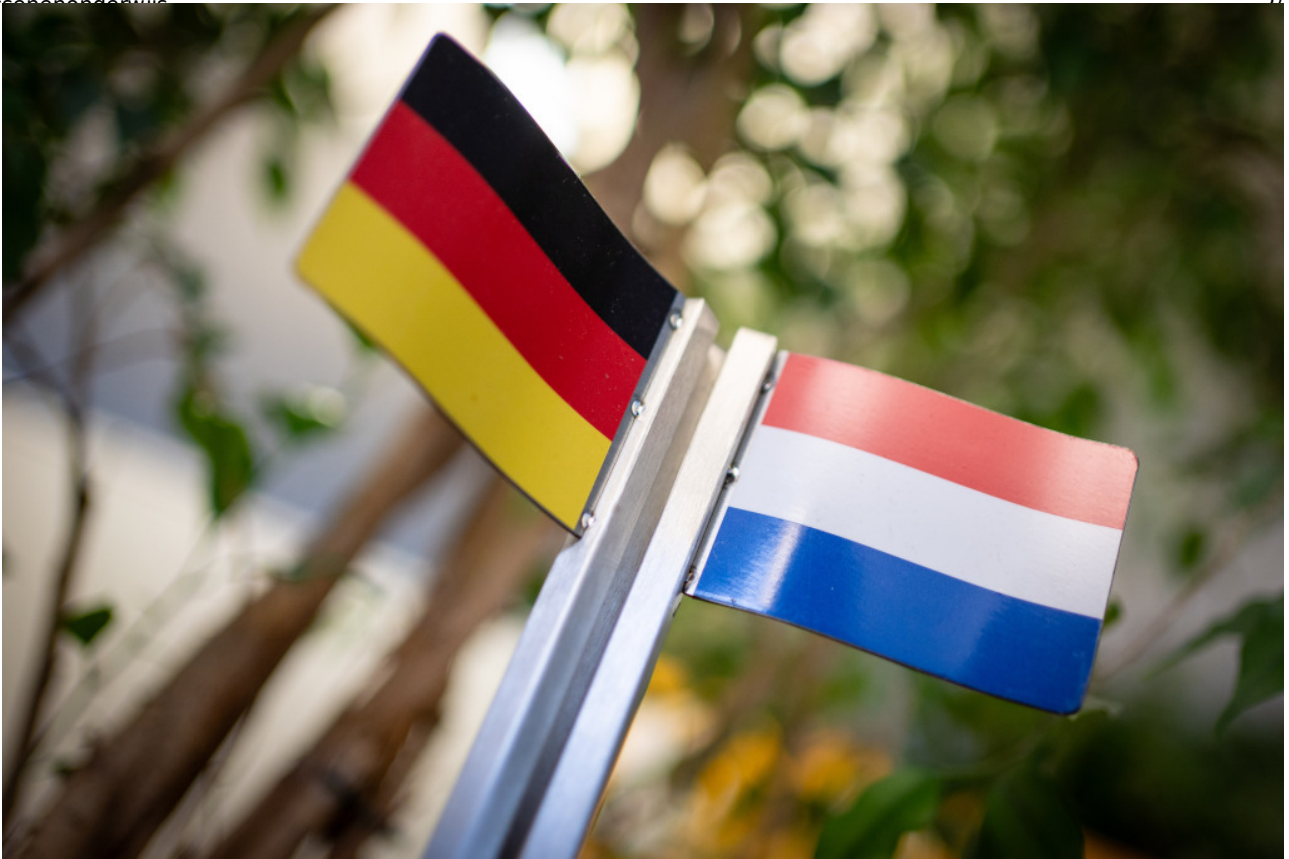
Duits-Nederlandse vlaggen.