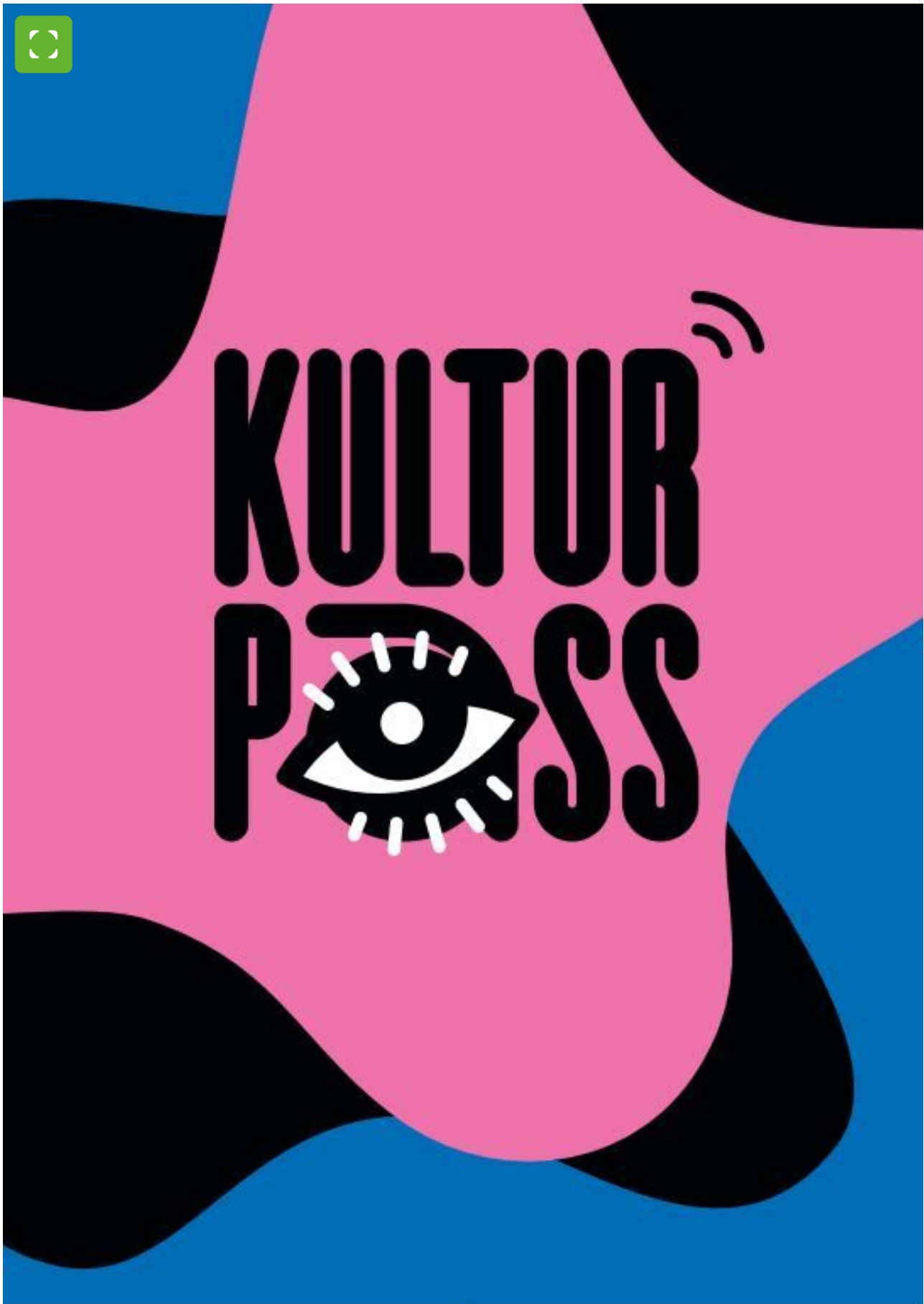
Logo van de landelijke "KulturPass" campagne © Bundeministerium Kultur und Medien