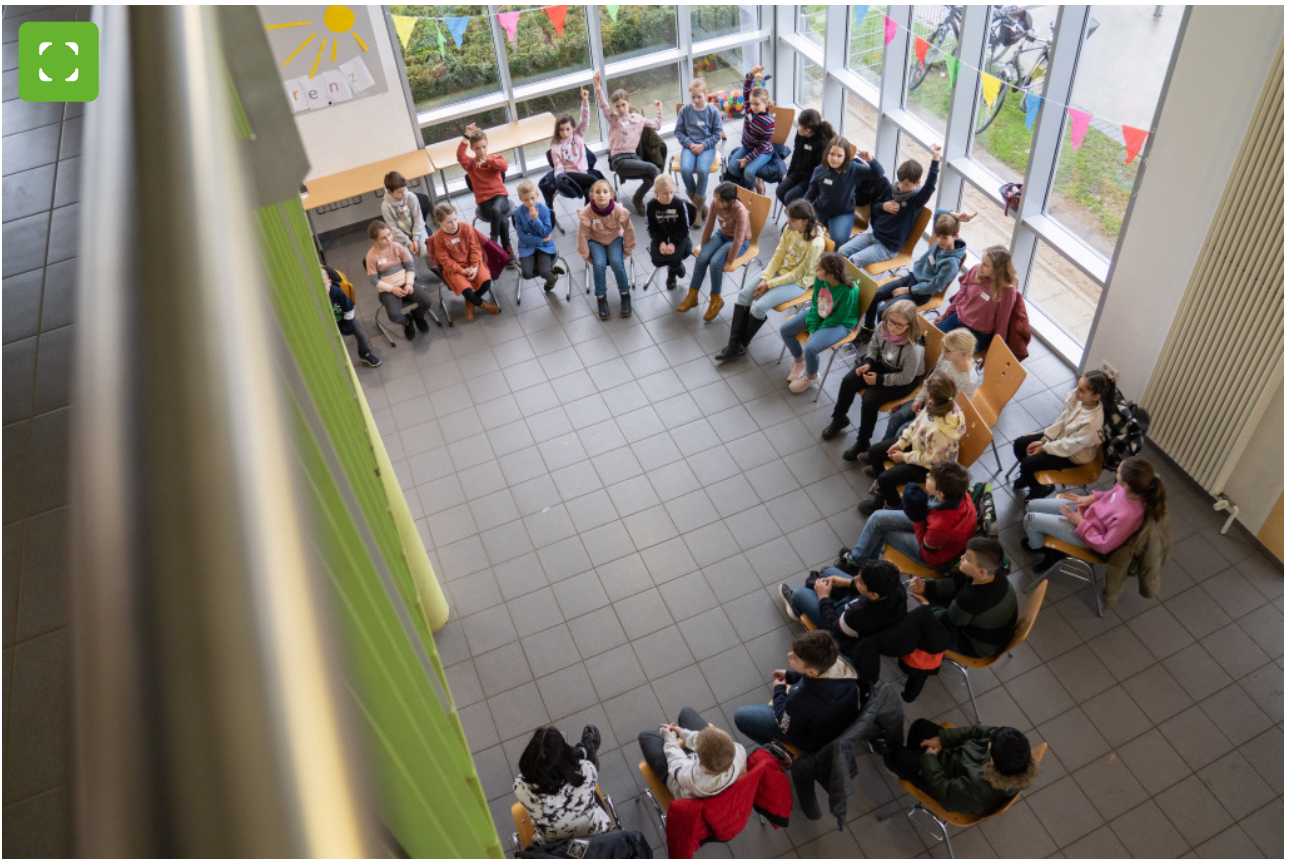
De leerlingen van de gemeenschappelijke basisschool Annette-von-Droste-Hülshoff presenteren hun wensen en suggesties