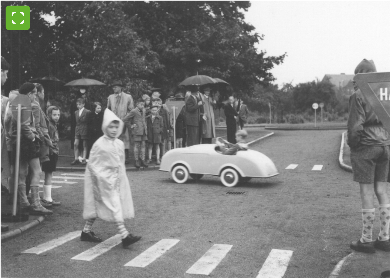
Verkehrsschule damals: Historisches Motiv aus den 1950-er Jahren in Bocholt.