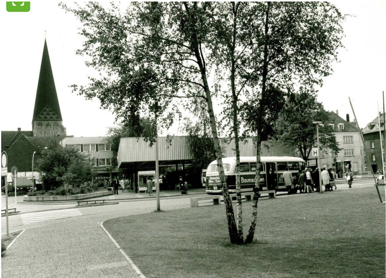
De nieuwe centrale bushalte (ZOH)