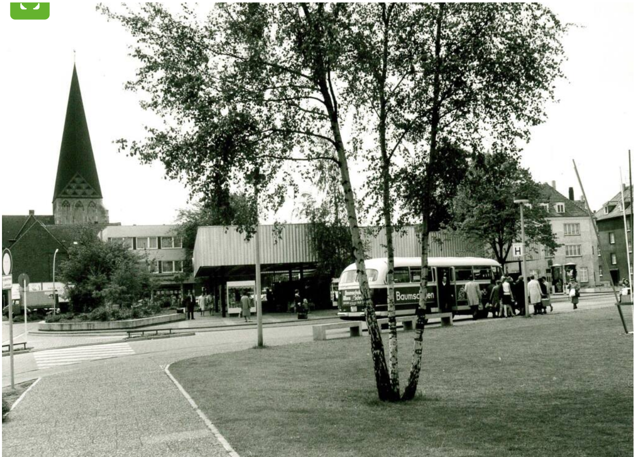
De nieuwe centrale bushalte (ZOH)