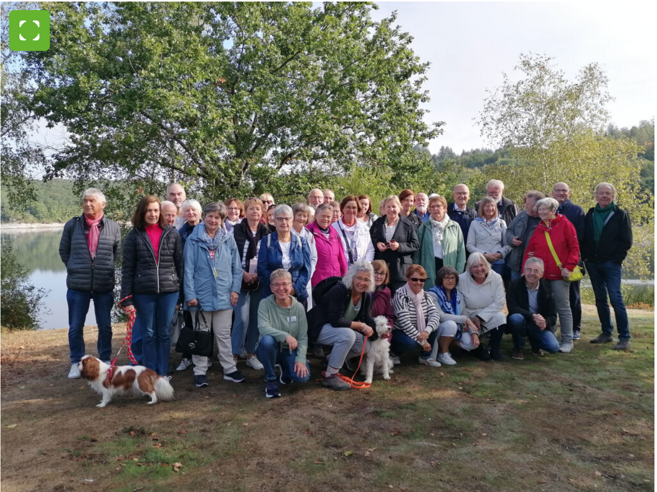
De reisgroep van Bocholt op de gezamenlijke uitwisseling