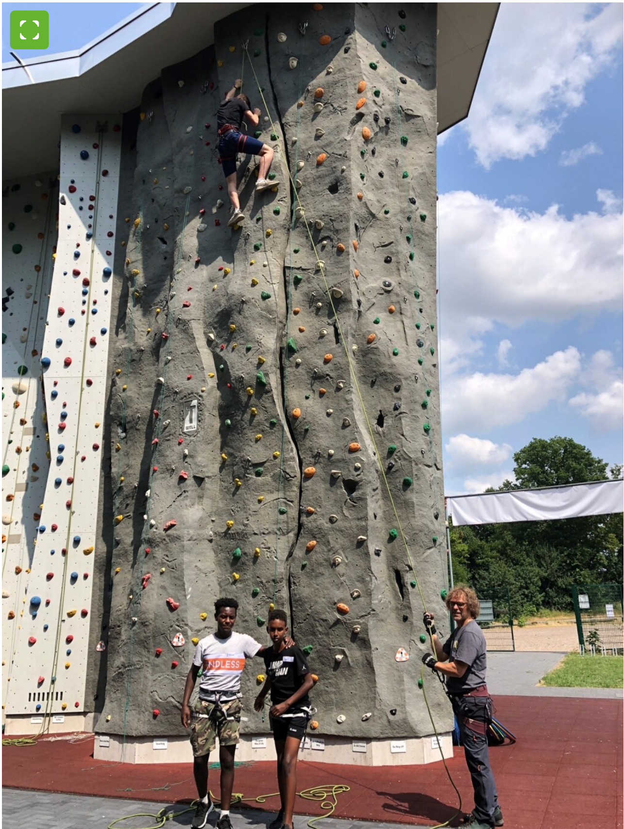
Het "SonsBerg" klimpark brengt je hoog boven de grond