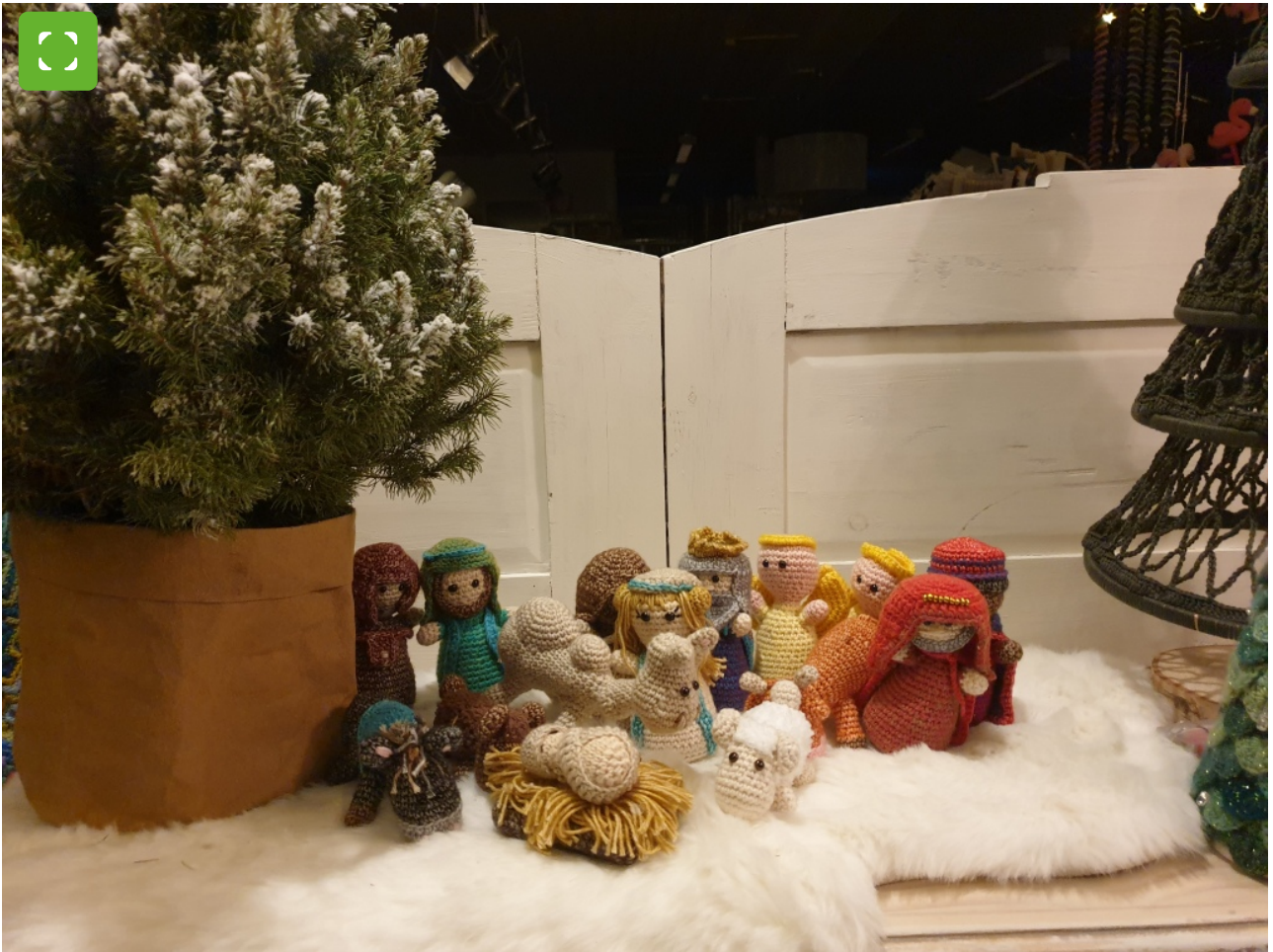
Die Vorbereitungen für die Krippentour laufen.