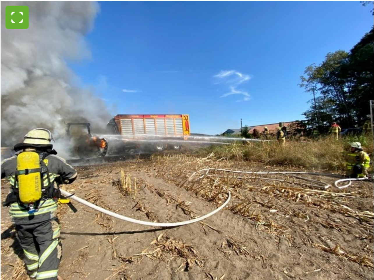
Delete 2