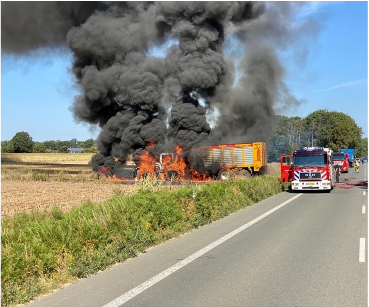
Aankomst van de brand