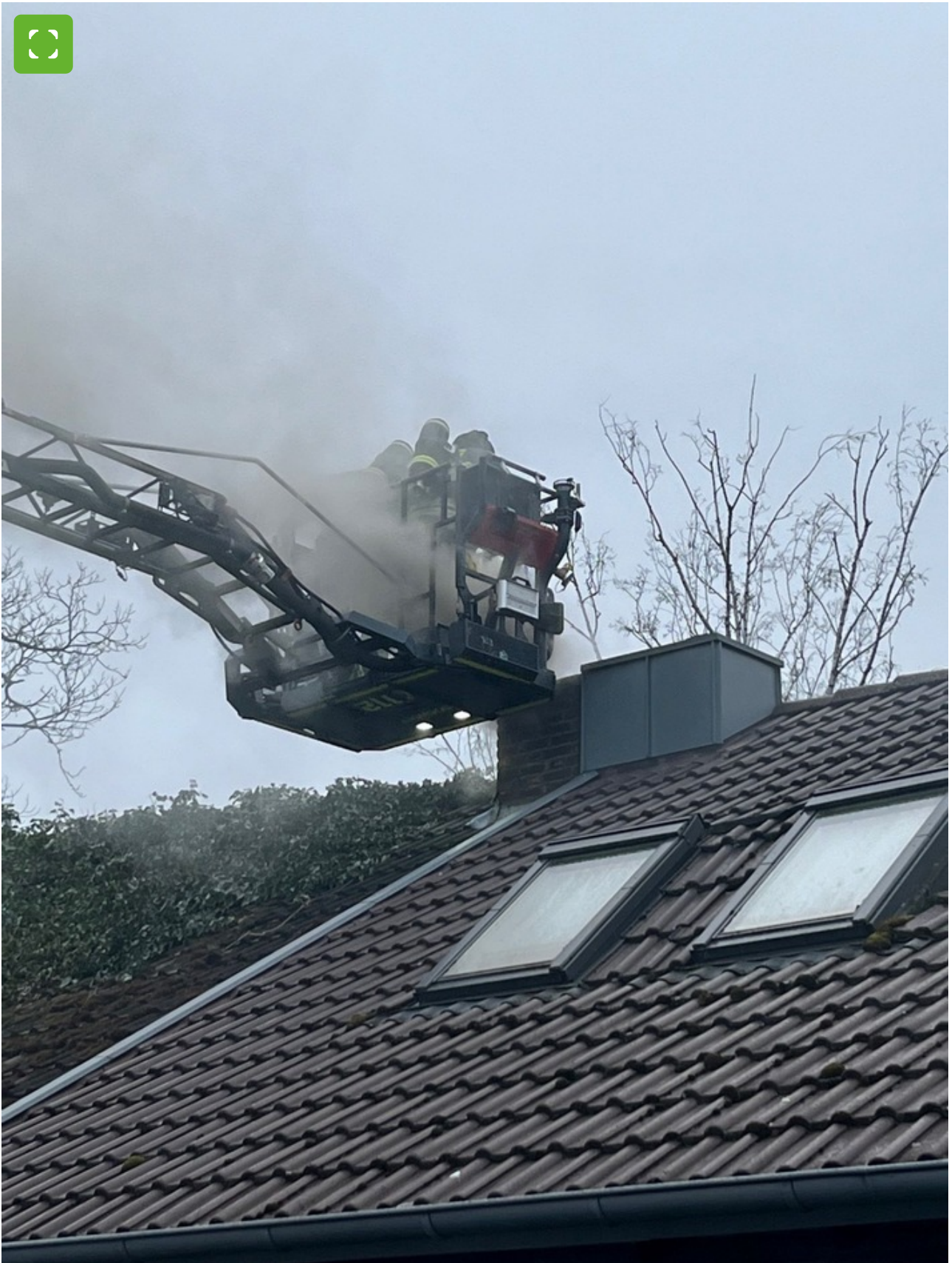
Brandende schoorsteen wordt geveegd van de draaischijf-ladderkorf.