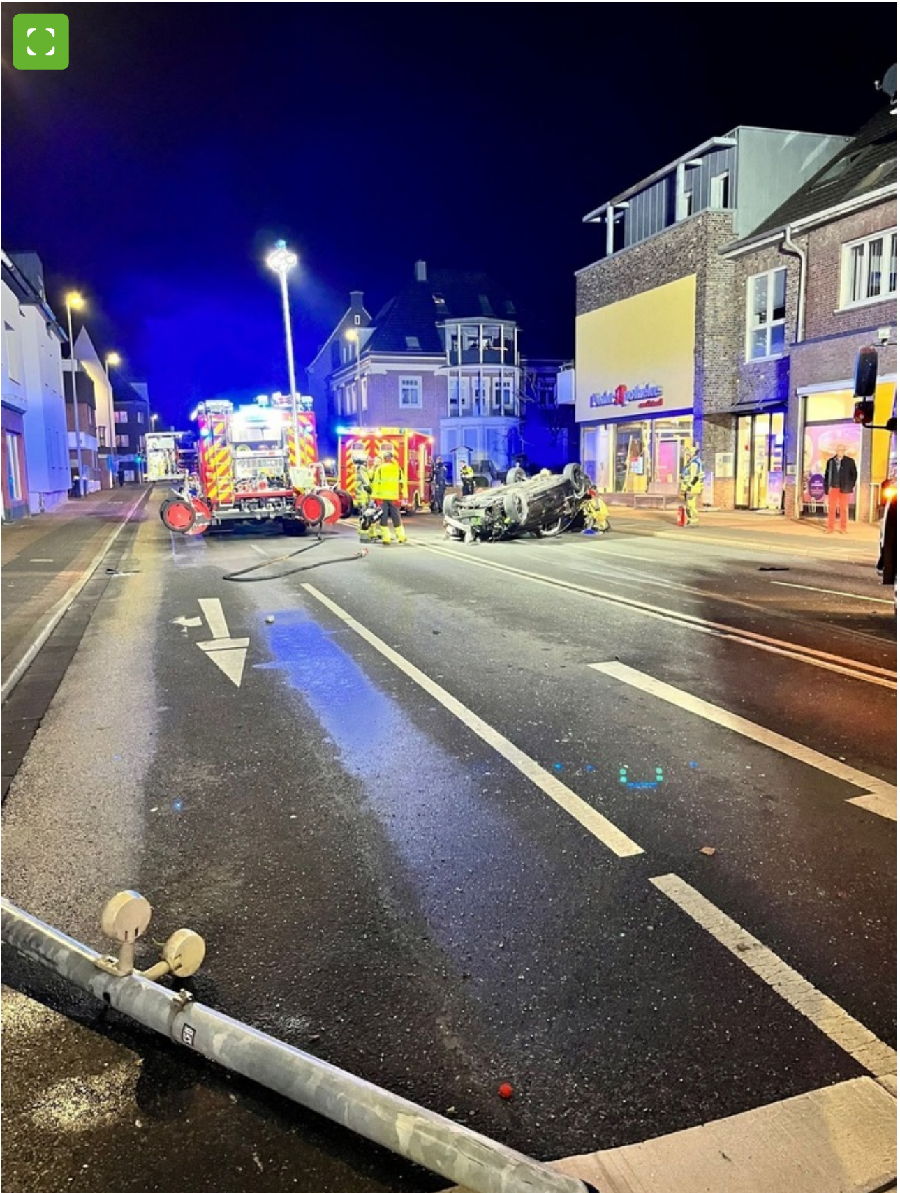
Voertuig ligt op zijn dak op Ostwall na ernstig verkeersongeval.