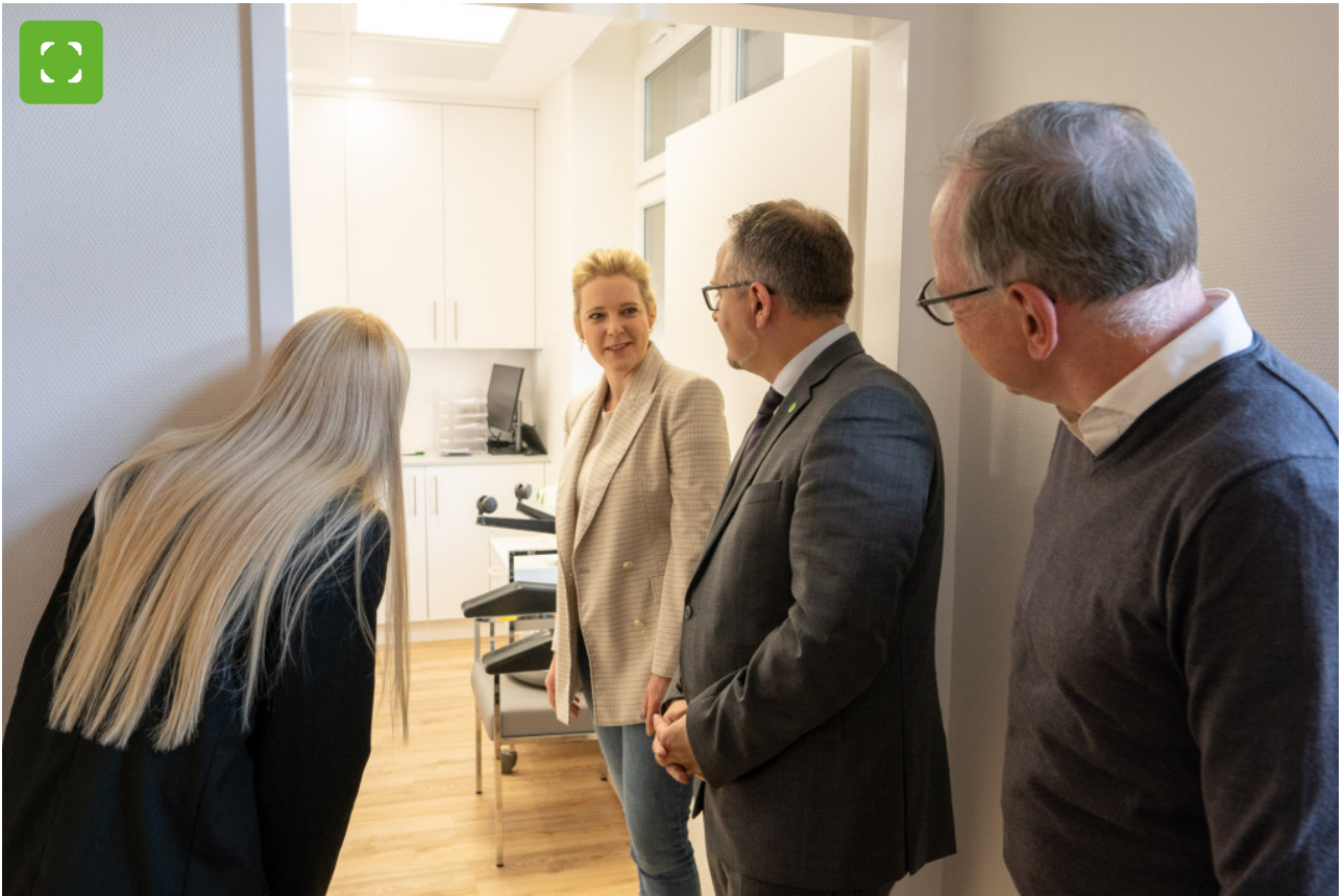
Die Räume der Praxis wurden komplett neu gestaltet