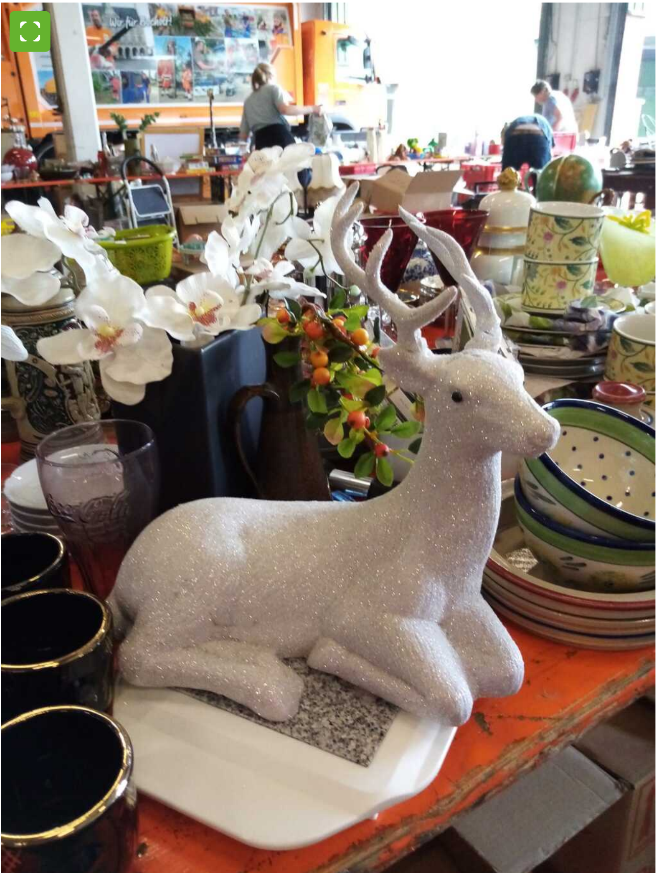
Kerstartikelen staan centraal bij de volgende grofvuilruil.