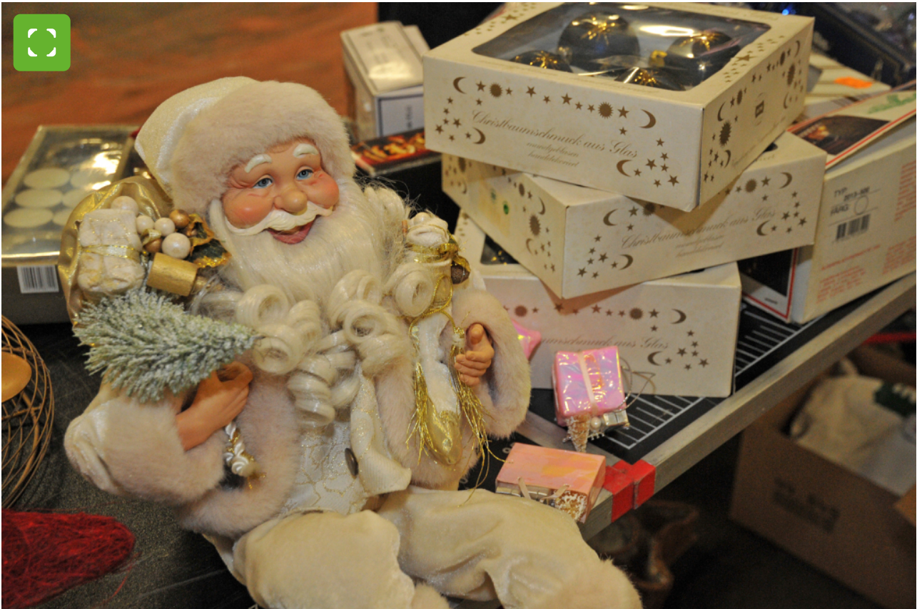
De ESB-ruilbeurs voor grofvuil met kerst gaat ook over hergebruik.