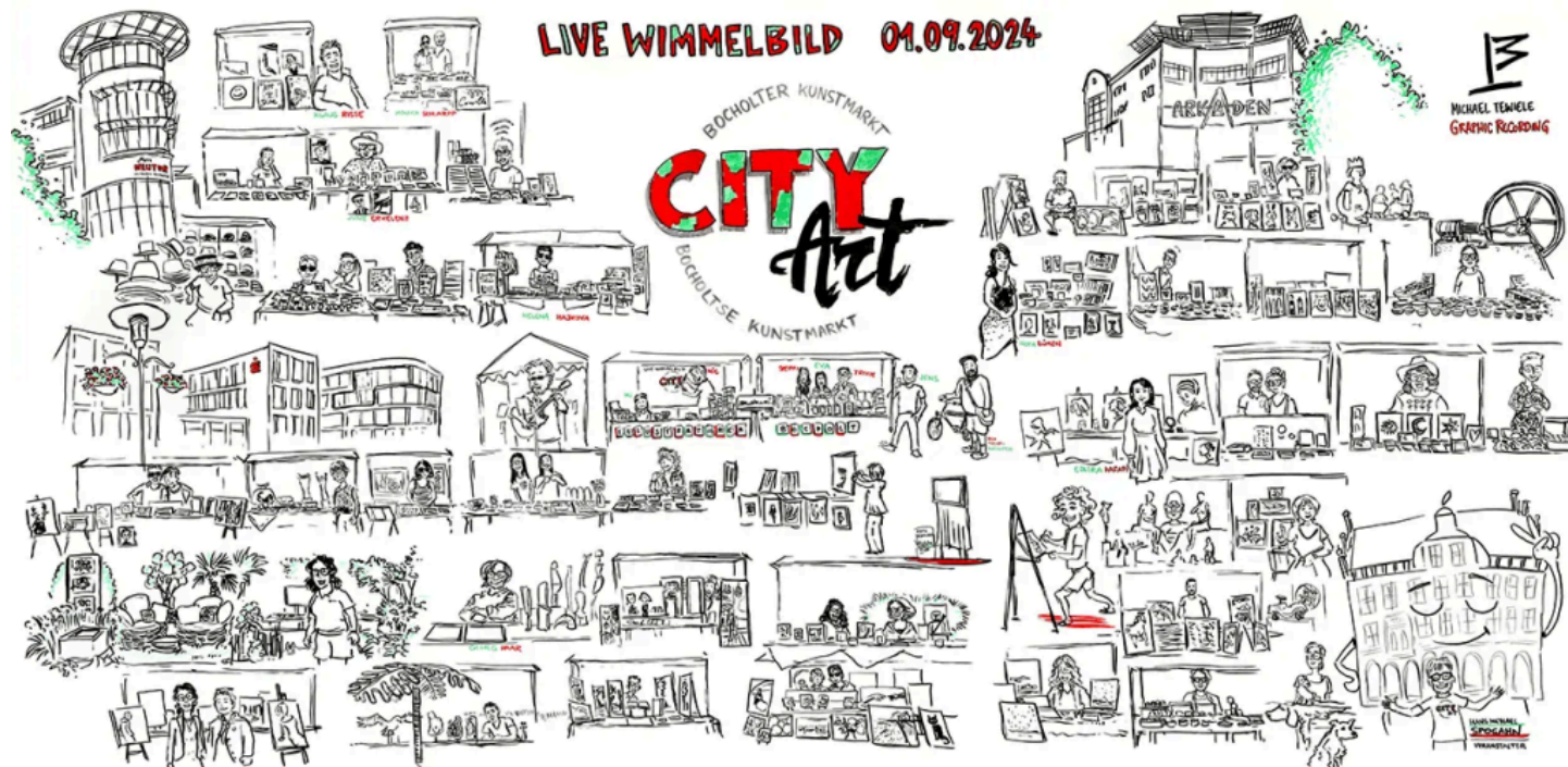
Von Michael Tewiele live während des CityArt-Kunstmarktes 2024 erstellt. Gemaakt door Michael Tewiele tijdens de CityArt kunstmarkt 2024.

Zondag 30 augustus // van 11.00 tot 18.00 uur