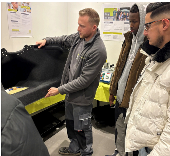
Nacht van de training ►

Het tekort aan geschoolde arbeidskrachten stelt bedrijven voor grote uitdagingen. Om u te helpen bij uw zoektocht naar de juiste geschoolde arbeidskrachten, vindt u hier verschillende projecten en evenementvormen die in en rond Bocholt zijn opgezet, succesvol waren/zijn of voor het eerst worden aangeboden.