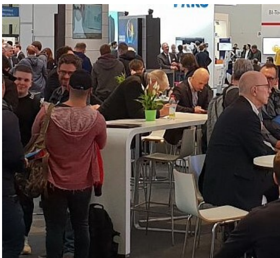
Bocholter Jobbörse ►