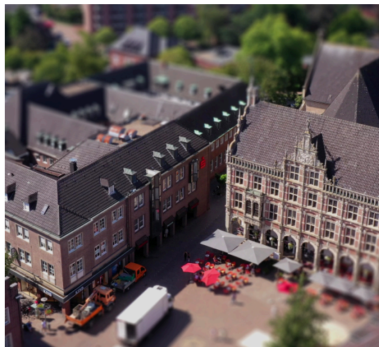
Service Onboarding@Münsterland ►