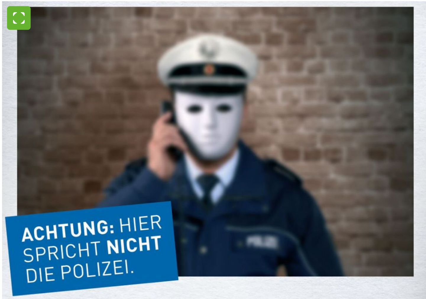
Afbeelding van de campagne "Dit is niet de politie die spreekt".

Kleinzonenzwendel, schokoproepen of "neppolitieagenten" - er is een breed scala aan zwendelpraktijken waarmee oplichters vooral oudere mensen van hun geld proberen te beroven.