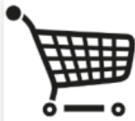
Shopping & Service