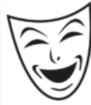
Freizeit & Kultur