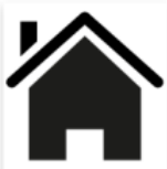
Leben & Wohnen