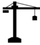
Planen & Bauen