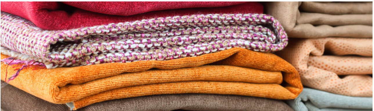
Oude kleren ▶