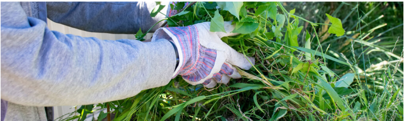
Ophalen van groenafval ▶