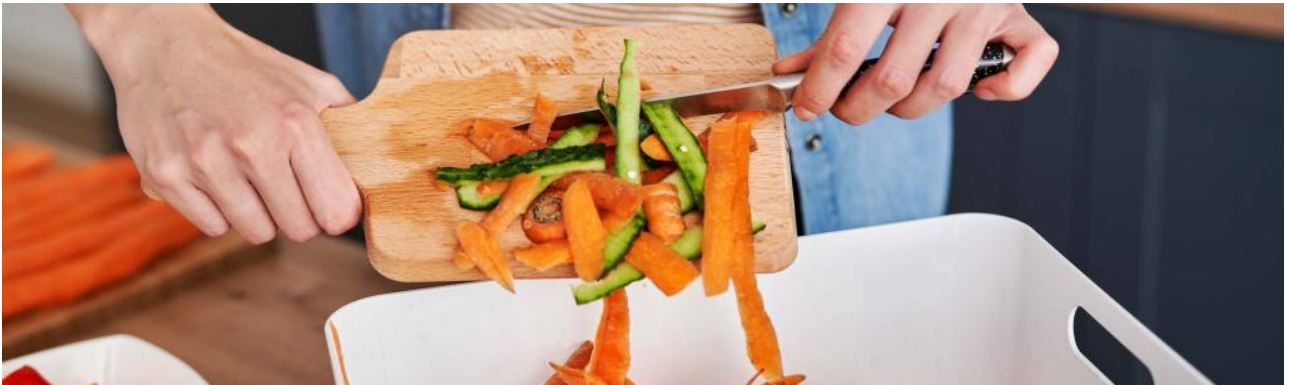
Organisch afval ▶