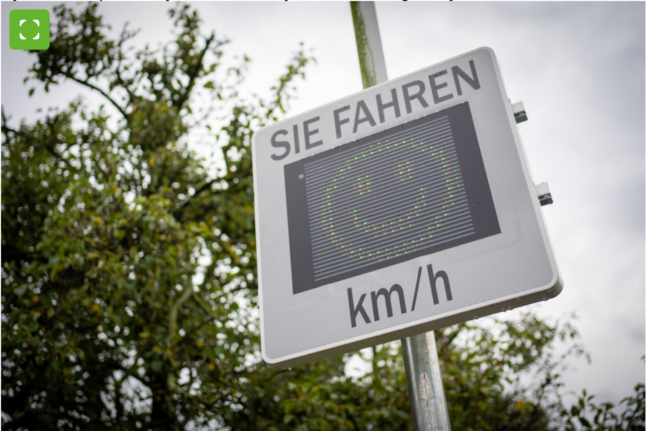
Snelheidscontroleborden maken automobilisten attent op hun snelheid