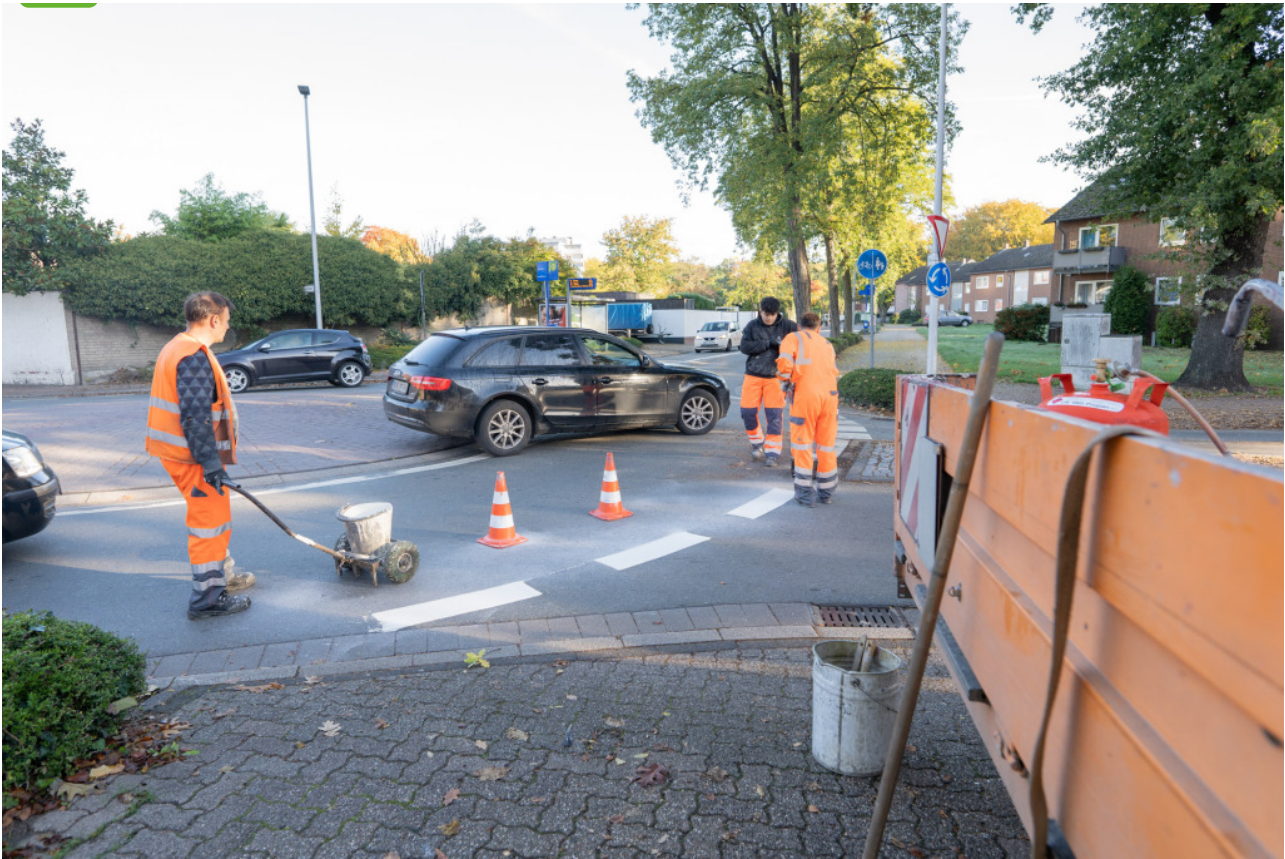
Aktuell werden die Fahrbahnmarkierungen am Kreisverkehr "Unter den Eichen" erneuert und die neuen Markierungen aufgebracht