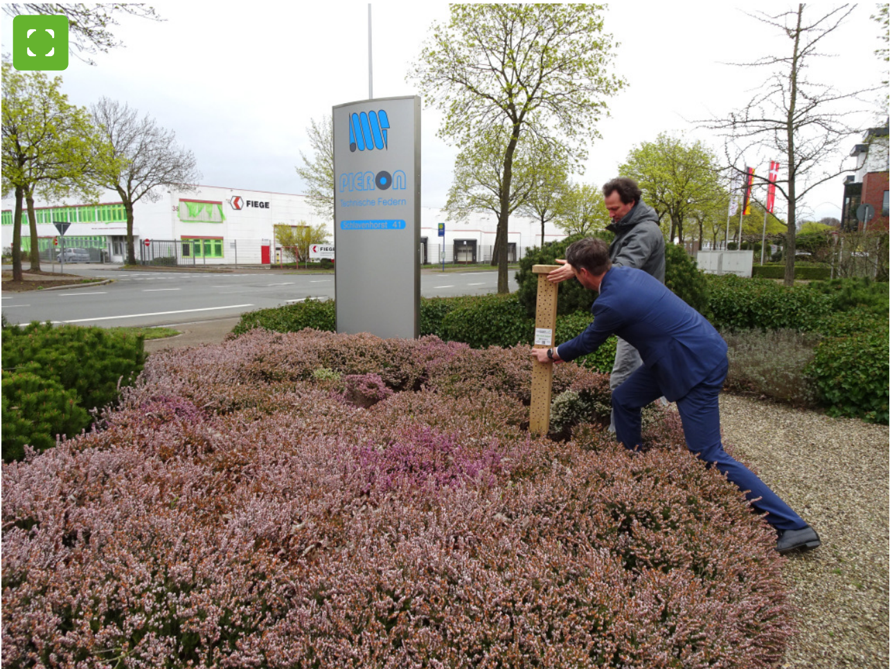
Das neue Insektenhotel verschönert den Bereich vor dem Unternehmen Pieron