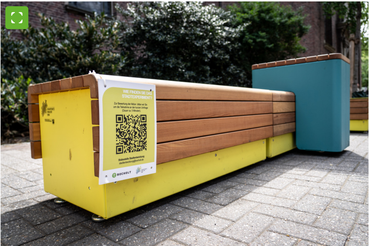
Auch an der Wesemannstraße, im Schatten der Liebfrauenkirche, stehen Sitzmöbel für die Bocholter Stadtterrassen. Wer mag, kann hier eine kleine Pause machen.