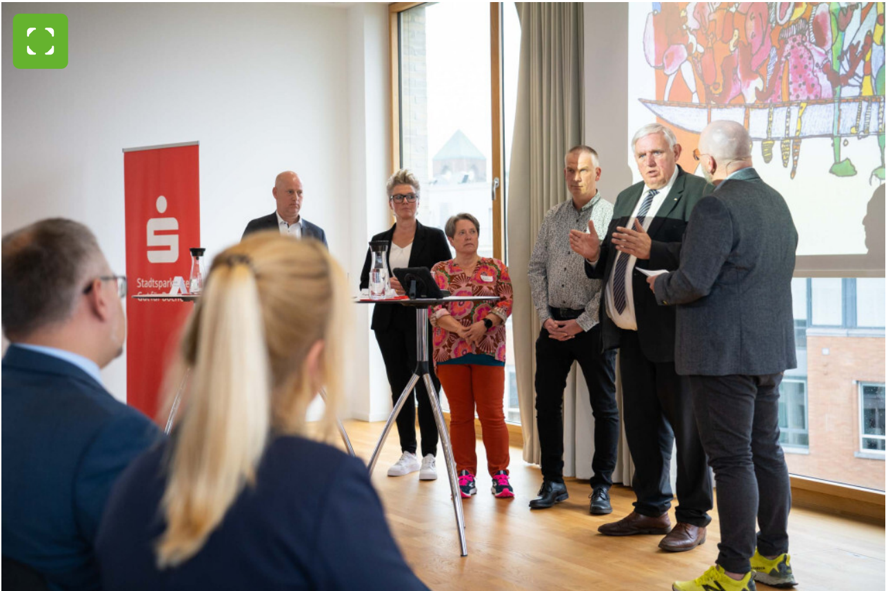
NRW-Gesundheitsminister Karl-Josef Laumann (2. v.r.) diskutiert mit Fachleuten aus Bocholt über das Thema Pflege.

Bocholter Innenstadt der Öffentlichkeit vorstellen. "Der Pflege ein Gesicht geben", lautet an diesem Tag das Motto.