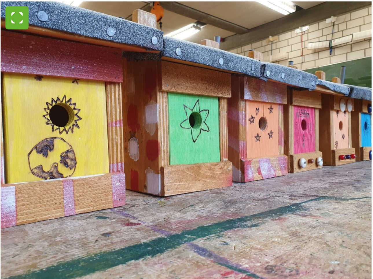
Bunte Nistkästen fürs Fildeken.