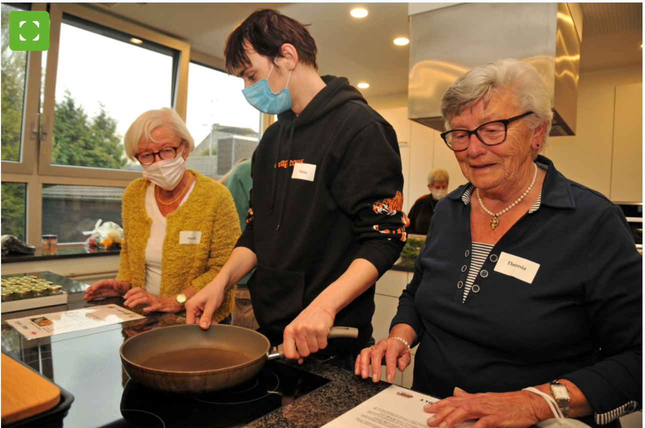
Gemeinsam kochen, ins Gespräch kommen und voneinander lernen. (Archivbild April 2022)