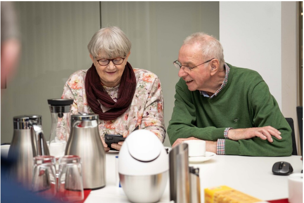
Die Gruppe Mouse Mobil hilft bei Fragen zu Computer, Smartphone und Tablet