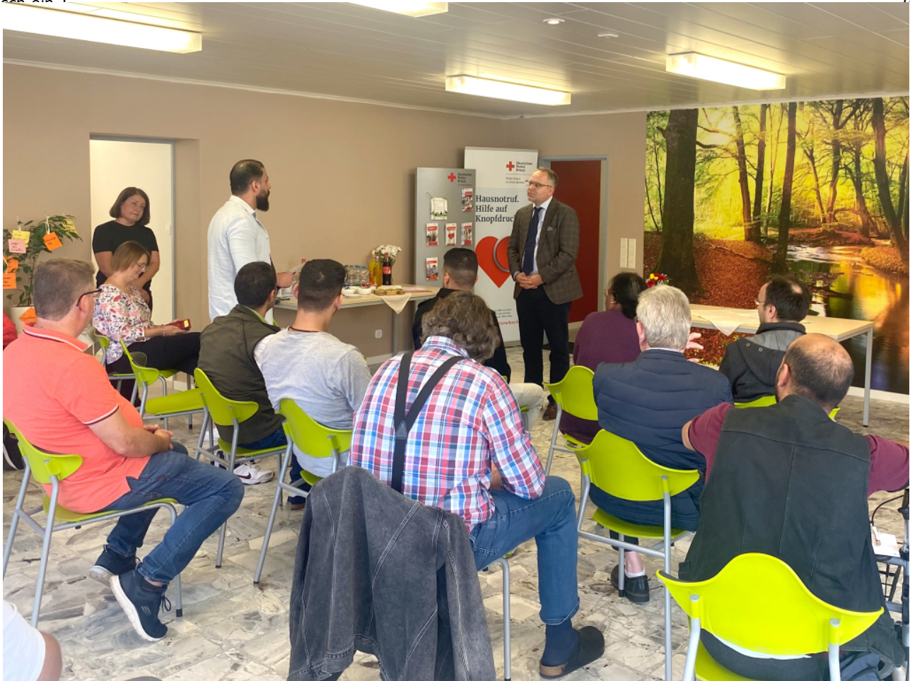
Bürgermeister Thomas Kerkhoff kommt in der Reihe "Bürgermeister vor Ort" mit Bürgerinnen und Bürgern ins Gespräch.