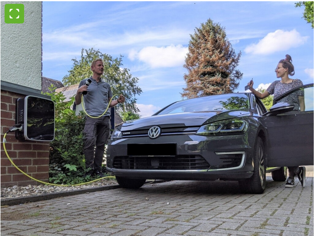
E-Carsharing kann auch in Bocholt erprobt werden.