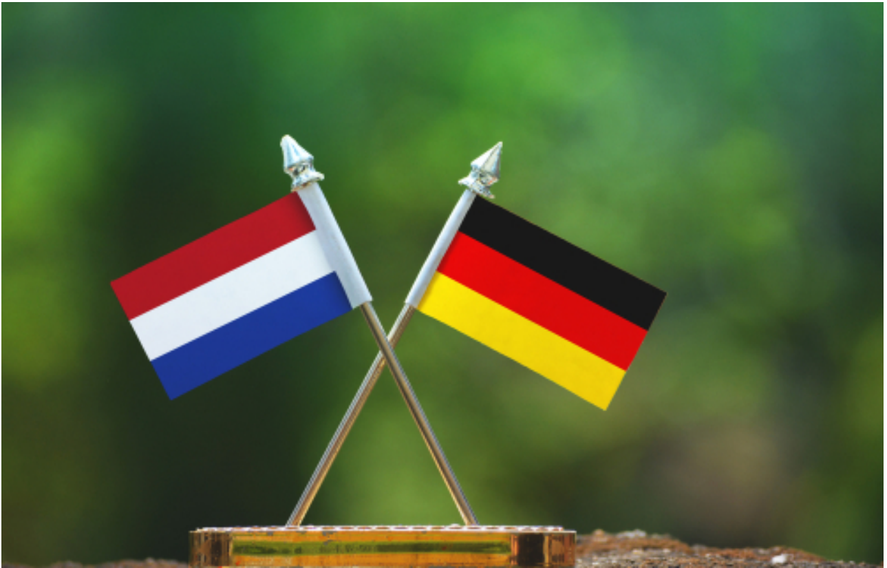
Deutsch-niederländische Flaggen.